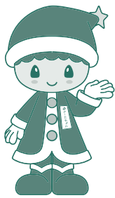
広尾町・キャラクターさーたちちゃん